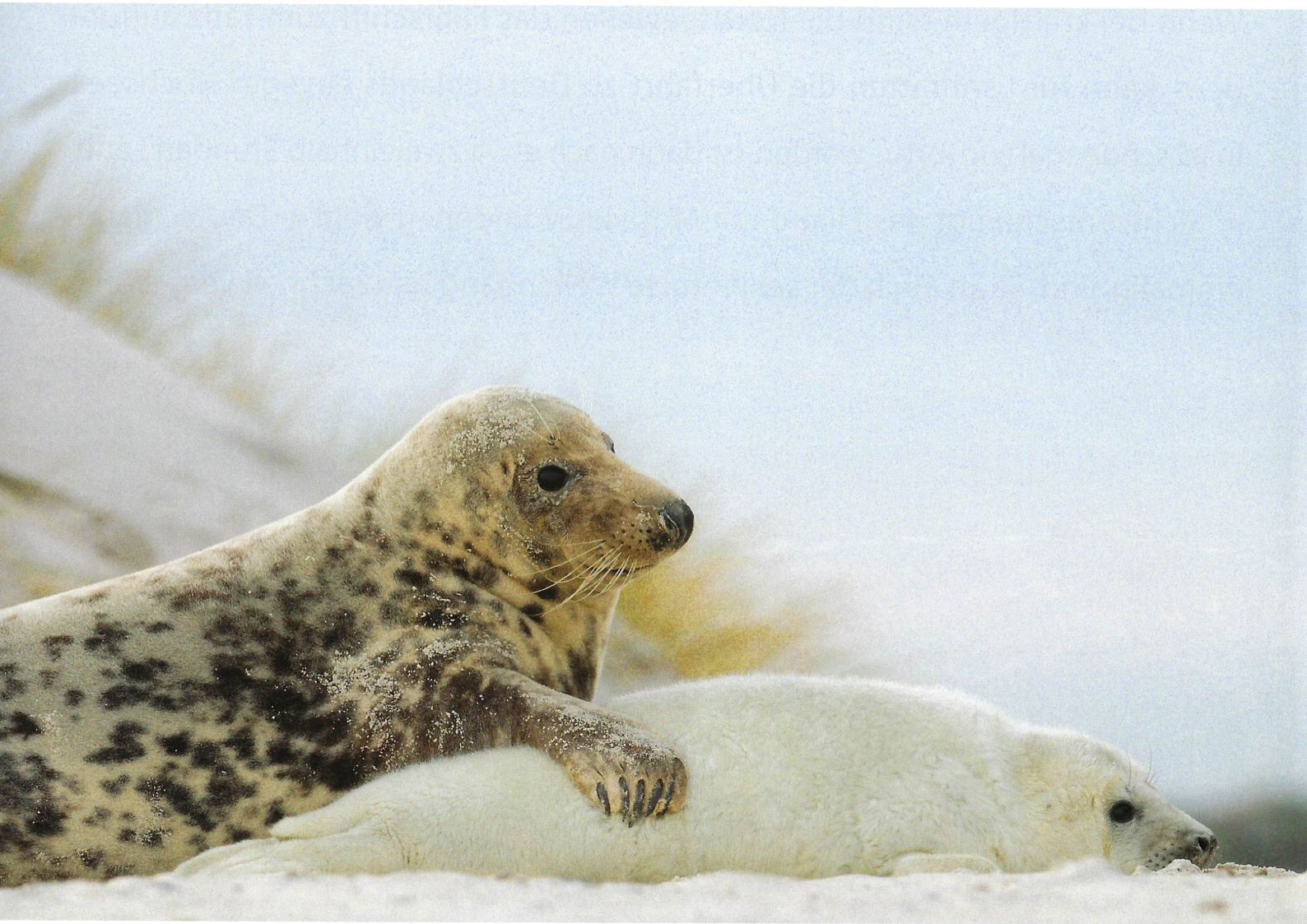
Die jungen Robben verbringen die Zeit am Strand überwiegend allein. Ihre Mütter sind derweil auf der Jagd in der Nordsee. Bei schlechterem Nahrungsangebot kann das Warten für die Jungen dauern. Dafür ist die Muttermilch derart nahrhaft, dass die Kleinen schnell wachsen und auch wenig gesäugt werden müssen. Das Aufeinandertreffen von Mutter und Jungem ist ein sensibler Moment, bei dem die Tiere den Menschen dulden, wenn er Abstand hält.

Bei meinen Besuchen auf Helgoland erwies sich stets der Winter als die stürmischste Zeit. Wer das umgehen möchte, kann die Insel auch zu jeder anderen Jahreszeit besuchen, denn zu fotografieren findet sich praktisch immer etwas. Aber natürlich gilt auch auf Helgoland, dass bestimmte Zeiten eben bestimmte Highlights mit sich bringen. So sollte man sich Gedanken darüber machen, was einen besonders interessiert und zur entsprechend bestmöglichen Jahreszeit für das Motiv anreisen. Auf dem eigentlich kleinen Raum sind die fotografisch interessanten Themen aber nicht nur zeitlich, sondern sogar auch noch räumlich getrennt. Denn Helgoland besteht zum einen aus der Hauptinsel mit Ortschaft, dazugehöriger Infrastruktur