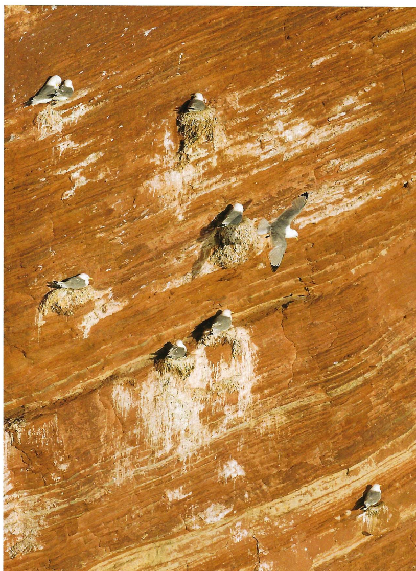
In der wärmeren Jahreszeit herrscht an den Vogelfelsen Hochbetrieb. Es ist immer wieder erstaunlich, wie die Vögel ihre Nester wiederfinden und Zusammenstöße in der Luft vermeiden. Neben klassischen Vogelbildern besteht auch die Möglichkeit, mit der Grafik und Farbe der Felswände und Vogelansammlungen zu arbeiten. Farbe bringen auch die Strandkörbe ins Bild, die gerne von Möwen oder Austernfischern als Aussichtstürme genutzt werden.

→ Die winterlichen Strände auf der Düne lohnen auch wegen der Vögel. Vor allem Sanderlinge und Steinwälzer sind anzutreffen. Dabei zeigen diese Strandläufer eine geringe Fluchtdistanz. Man braucht sich nur in der Richtung, in der sie den Strand nach Nahrung suchend ablaufen, hinzuhocken oder hinzulegen und zu warten. Sie werden nur wenige Meter an einem vorüberziehen. Dabei sind sie leider sehr agil. Für einen zweiten Versuch überholt man sie einfach in entsprechendem Abstand und legt sich erneut auf die Lauer. Manchmal entdecken sie eine reichhaltige Nahrungsquelle und graben vereint an einer Stelle den Sand um. Dann kann man sich vorsichtig annähern und über einen längeren Zeitraum versuchen, ein Bild zu bekommen.